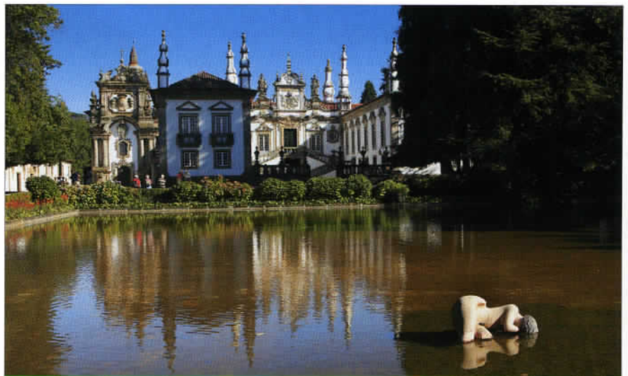
Le manoir de Mateus, près de Vila Real, est un bijou de l'architecture baroque et un lieu très reposant. Même les statues semblent partager notre avis...

les troupes napoléoniennes. Sans oublier l'église du monastère Sao Gonçalo, l'hôtel de ville et son musée, ainsi que l'église Sao Pedro. A proximité de Vila Real se trouve le manoir de Mateus, véritable joyau de l'architecture baroque du XVIII e siècle. Une élégante bâtisse agrémentée de magnifiques jardins et d'un "miroir d'eau" où repose une jolie statue de femme couchée. L'un de nos sites préférés. Plus au nord, Guimaraes, première capitale du Portugal au XII e siècle, possède un centre historique médiéval classé par l'Unesco en 2001. Il est composé d'un château dominé par un donjon de 28 mètres de haut, d'une église romane et d'un palais des ducs de Bragança. A noter par ailleurs, la largo da Oliveira, le couvent Notre-Dame de l'Olivier et la Praça de Sao Tiago. Somme toute, une étape plaisante. Encore plus au nord, Braga, la "Rome" du Portugal, compte une multitude d'églises et