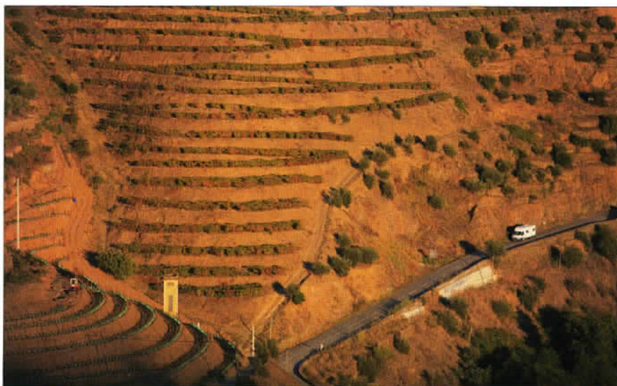
La vallée du Douro, un paysage aride étonnant que le travail des hommes a transformé en terrasses fertiles, plantées de vignes et de champs d'oliviers.