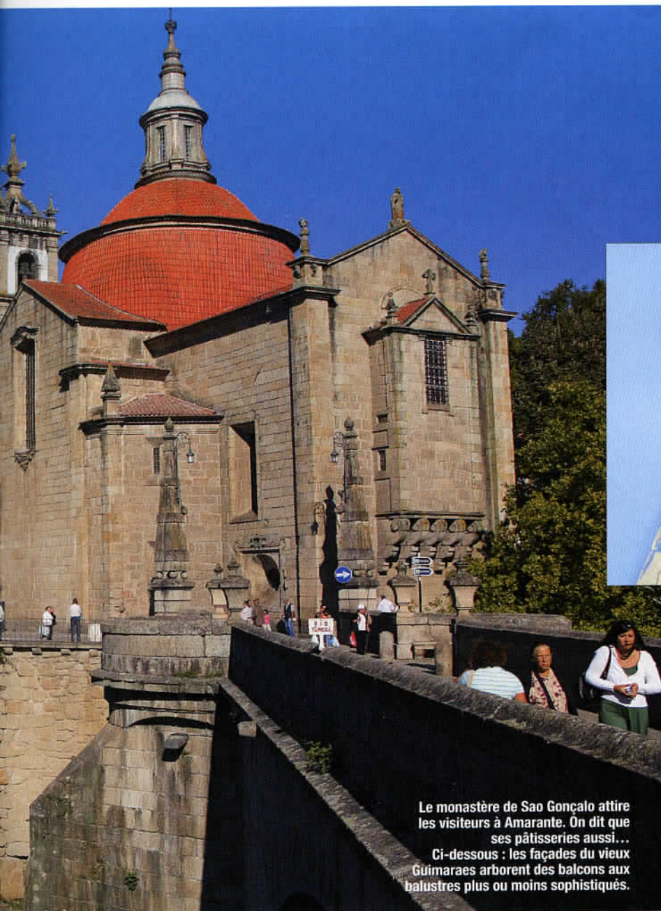
Le monastère de Sao Gonçalo attire les visiteurs à Amarante. On dit que ses pâtisseries aussi... Ci-dessous : les façades du vieux Guimarães arborent des balcons aux balustres plus ou moins sophistiqués.