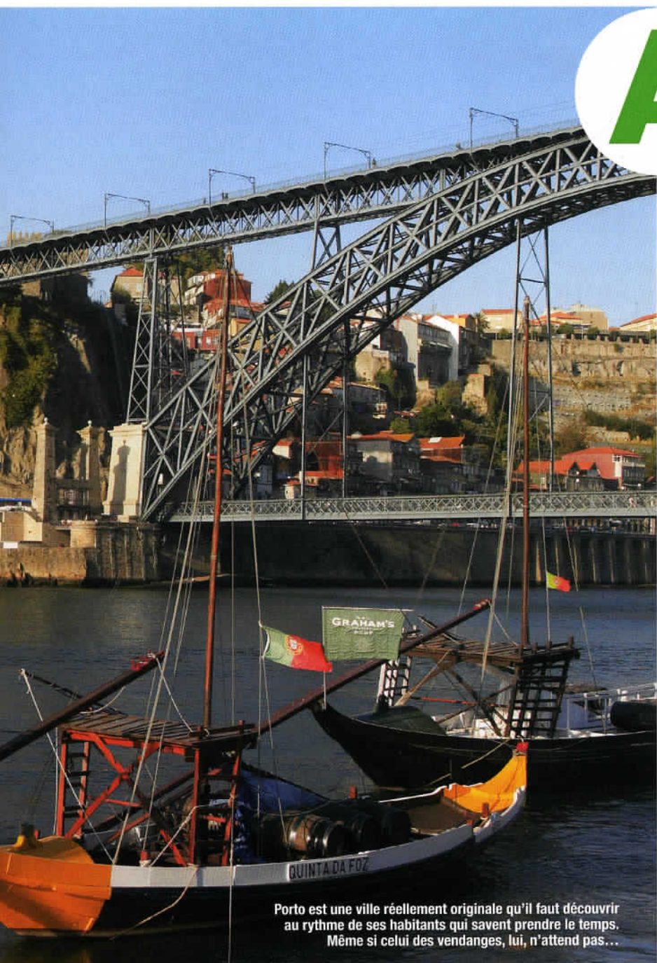
Porto est une ville réellement originale qu'il faut découvrir au rythme de ses habitants qui savent prendre le temps. Même si celui des vendanges, lui, n'attend pas...