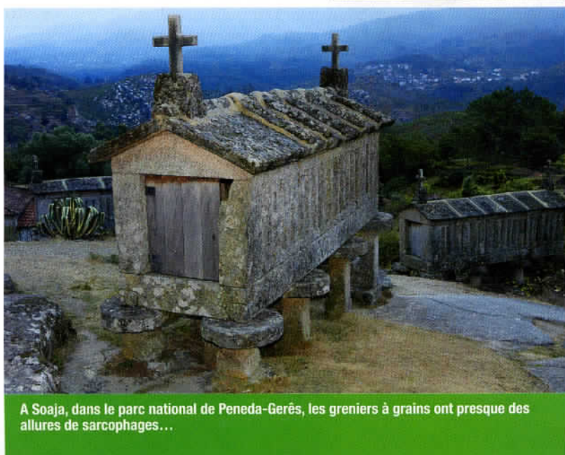
A Soja, dans le parc national de Peneda-Gerês, les greniers à grains ont presque des allures de sarcophages...